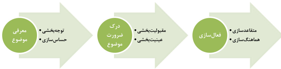
شکل ۲: چارچوب کارکردی برنامه فرهنگسازی